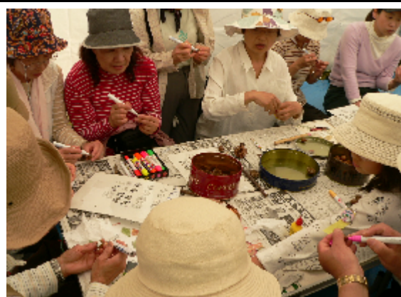
自然工作を楽しむお母さん方