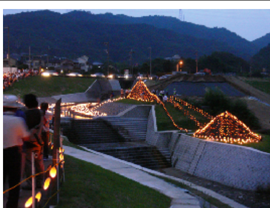
点火した大竹灯籠が美しい自然に映える