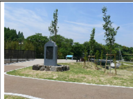
歌碑贈呈と植樹などで景観づくり