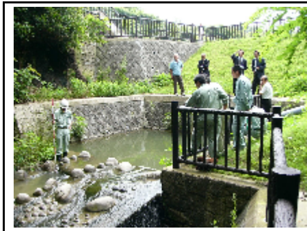
上流での浄化活動