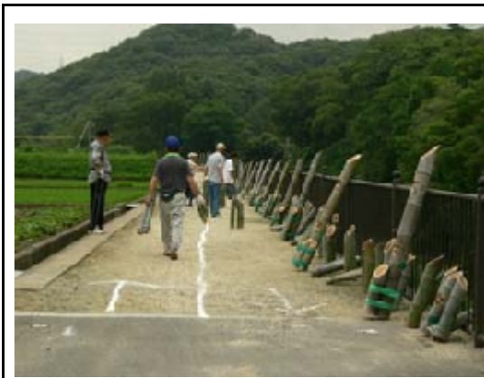
11地区による1.5キロの竹灯籠の道