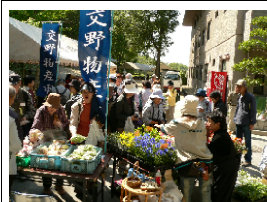
交野の農作物が飛びように売れる