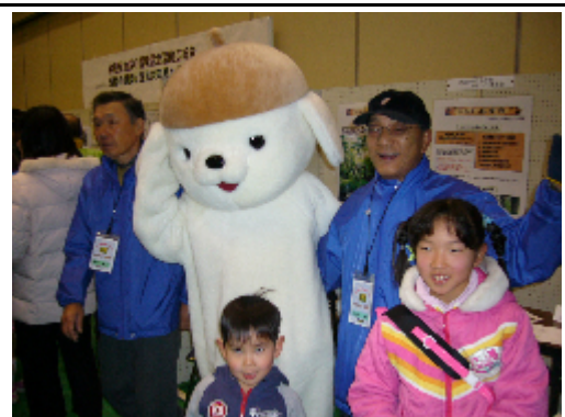
大阪府の「温暖化防止」マスコット