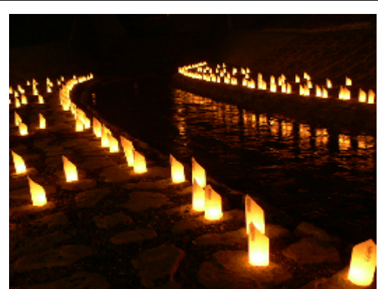
水辺の紙灯籠が作る初夏の幽玄世界