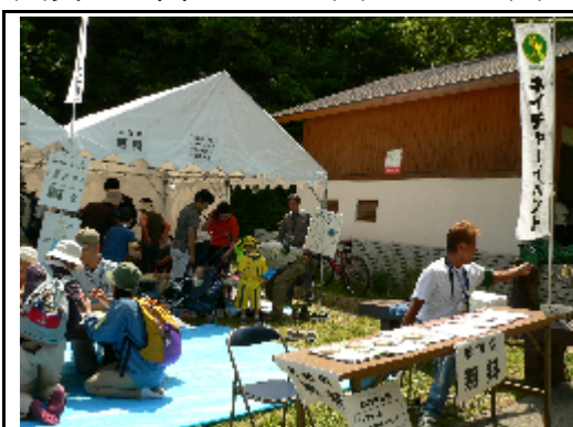
子供に自然工作など楽しんでもらう