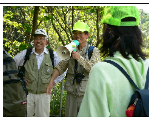
観光ボランティア