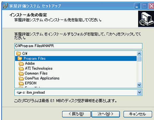
ディレクトリ設定画面

4、setup では、システムに必要な全てのファイルをインストールできます。ただし、Win9x, NT4.0 では「データベースが接続出来ません」のメッセージが出る場合があります。その場合は、Microsoft Data Access の確認をし下さい。本プログラムの使用にはデータベース関連の Microsoft Data Access Components のインストールが必要です。