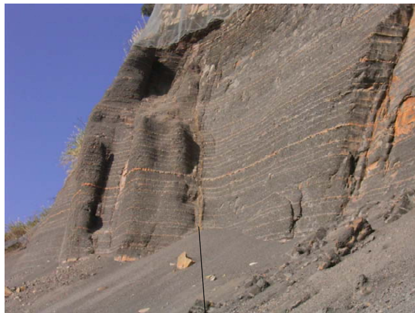
砂岩泥岩互層中の断層