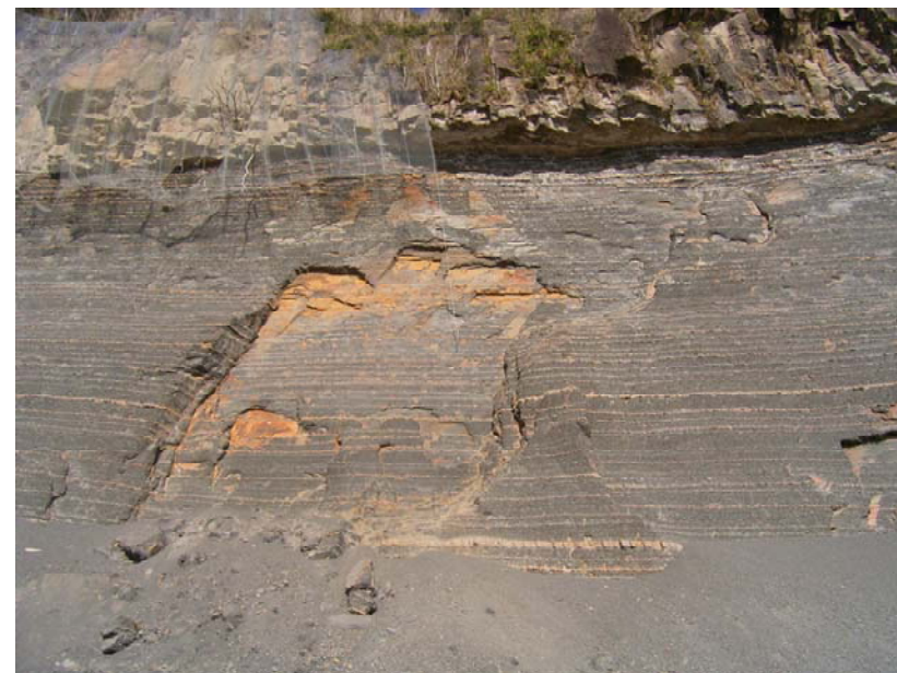
砂岩泥岩互層には表層滑落がみられる。 砂岩は節理が発達し、オーバーハングしている。