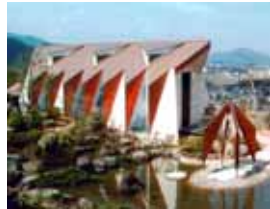
ロイヤルヒル福家殿 chapel