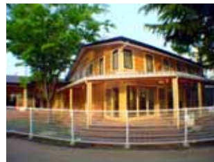
東京大学駒場保育所 nursery