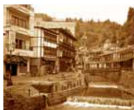
銀山温泉 和楽足湯 spring