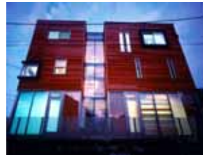
ST #2-SE house