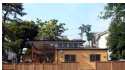
東京大学白金台ひまわり保育園 nursery