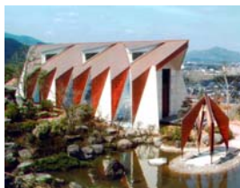
ロイヤルヒル福家殿 chapel